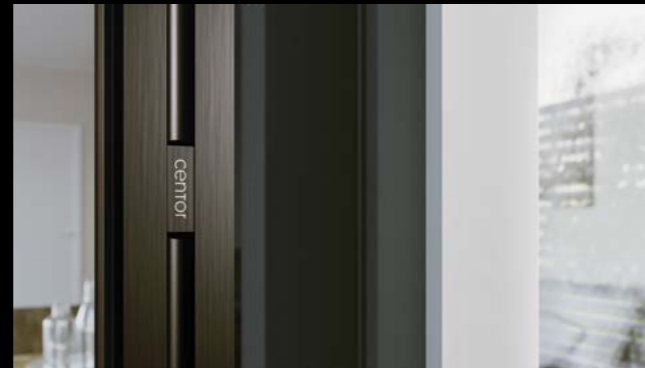
Schmale Insektenschutz Rahmenprofile

Alle Informationen zum S2 Insektenschutz finden Sie unter www.centor.com .