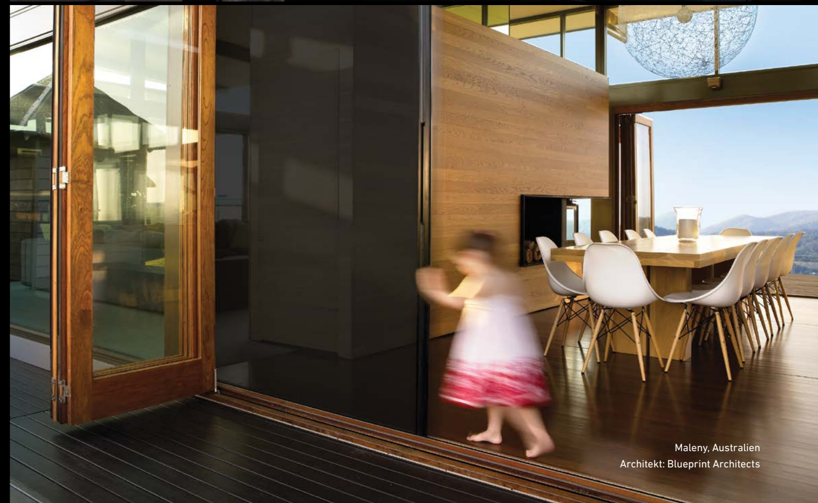
Maleny, Australien Architekt: Blueprint Architects