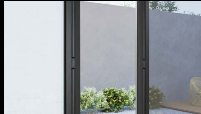
Kombinationskonfiguration mit Insekten- und Sonnenschutz

Alle Informationen zum S4 Insekten- und Sonnenschutz finden Sie unter www.centor.com .