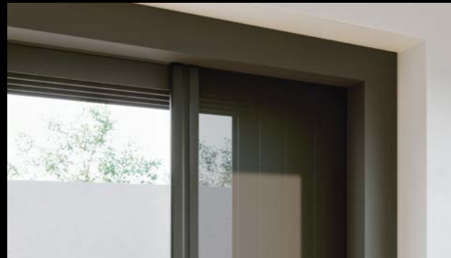
Aluminiumrahmen und Griffleiste

Alle Informationen zu Centors Insektenschutz finden Sie unter www.centor.com .